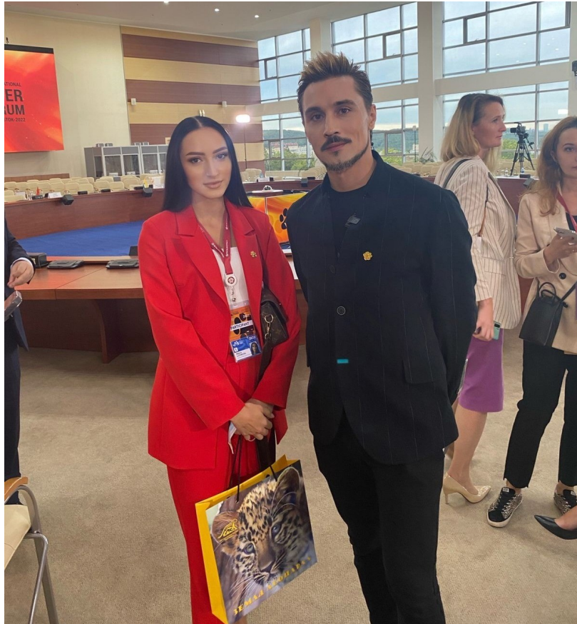
Участие в международном Тигрином форуме