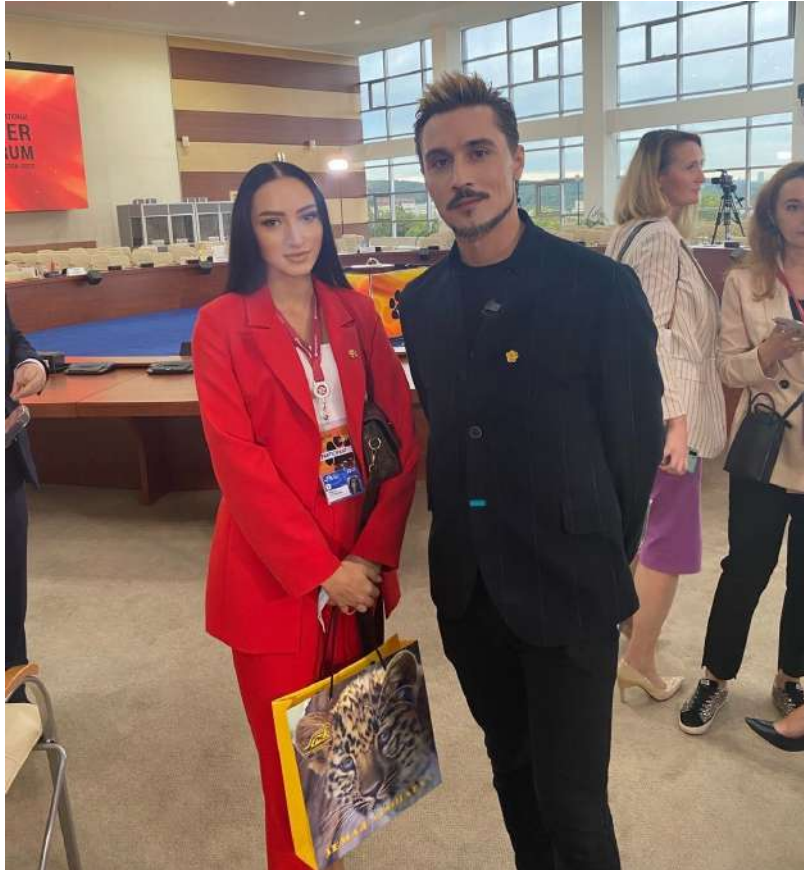
Участие в международном Тигрином форуме